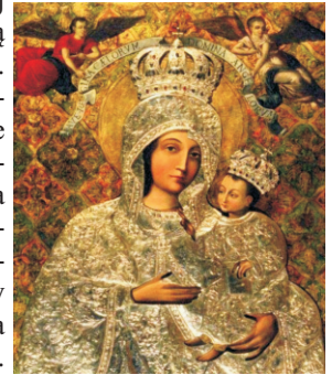
Laskami słynący obraz MB