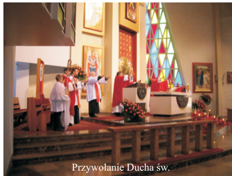
Przywołanie Ducha św.